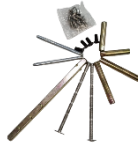
پیچ‌ها و پایه‌های نصب