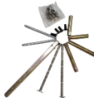
پیچها و پایه‌های نصب